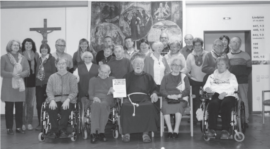
FKA Woche 2016

„Der Herr hat mich unter die Aussätzigen geführt“, schreibt er. Mehr noch: Sie war absolut unangenehm und abstoßend. Aussätzige auch nur zu sehen, war für ihn „bitter“. Diese Begegnung hat Franziskus angeekelt und in ihm massive Widerstände ausgelöst. Und sie war bedrohend und gefährlich: Nicht umsonst waren diese Kranken aus der Gesellschaft ausgeschlossen. Man hatte Angst vor ihnen, denn sie konnten das eigene Leben zerstören. Bitteres wird süß. In dem, was ihn anekelt, kommt Franziskus auf den Geschmack des Lebens. Das Störende gibt ihm Orientierung. Am Rand entdeckt er das, was für ihn dann zentrale Mitte seines Lebens sein wird.