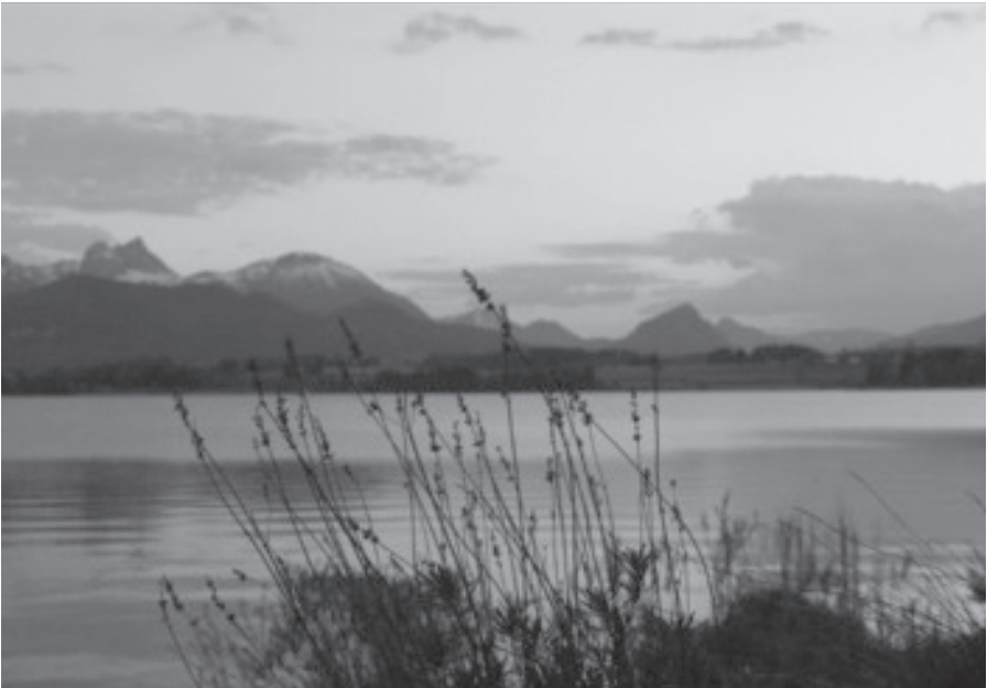
Sonnenuntergang am Hopfensee

Anschließend führen wir zum Hopfensee und beobachteten von einer Terrasse eines Lokals aus den stimmungsvollen Sonnenuntergang.